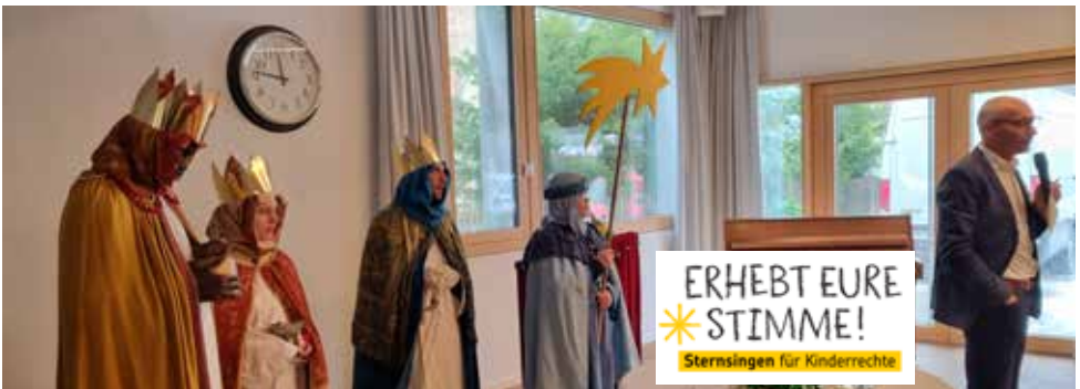
Neujahrsempfang der Marktgemeinde im Waaghaus

Spendensumme: 16.892,71 € . Danke für euer großes Engagement!