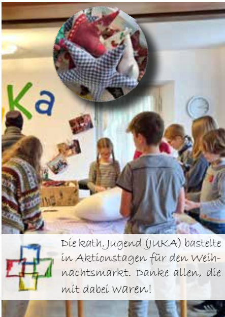
Die kath. Jugend (JUKA) bastelte in Aktionstagen für den Weihnachtsmarkt. Danke allen, die mit dabei waren!